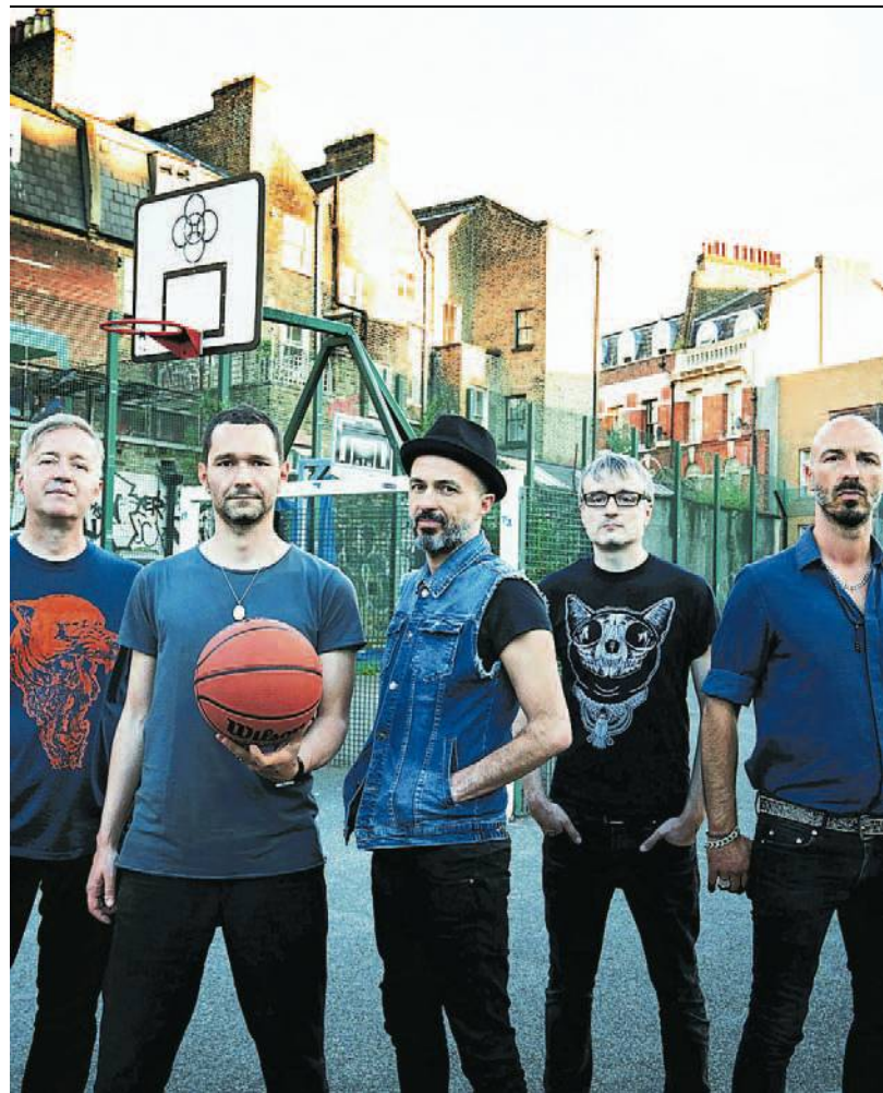
▲ I Subsonica sono al Rugby Sound di Legnano via Castello 1, ore 21,30, biglietti 23 euro, tel. 348.1533425