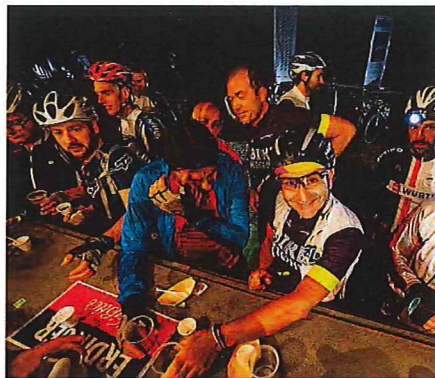
I partecipanti ad uno dei tre ristoranti. A destra: un bel primo piano di una delle partecipanti

Ormai anche i ciclisti sono sempre più allenati e se partecipano ad un evento - il discorso vale anche per gli altri sport - cercano quel qualcosa