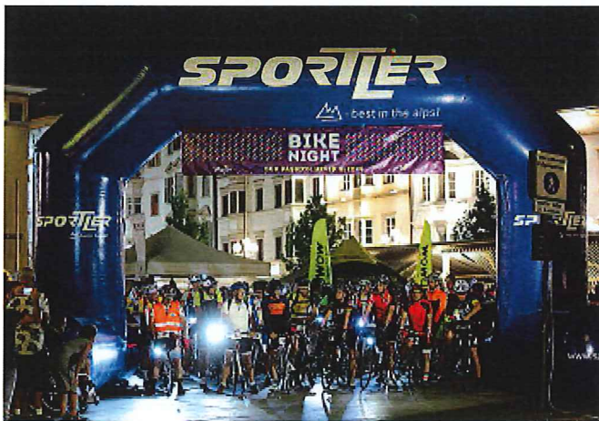
La partenza a mezzanotte da piazza Walther dei 168 ciclisti partecipanti

che lo renda particolare, per potersi mettere alla prova in situazioni diverse rispetto a quelle normali. Di gare lunghe dunque ce ne sono tante ovunque; con l'aggiunta di dislivelli paz-